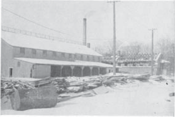
Le vieux gymnase, tout courbé, rempli de poussière, cède volontiers sa place à un édifice immense qui permet maintenant aux collégiens de ne plus redouter les jours pluvieux de l'automne et du printemps.