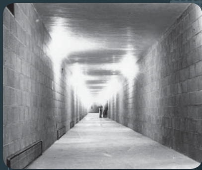
Le couloir souterrain reliant le gymnase au pavillon central.