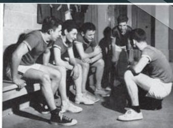
L'une des cinq chambres d'équipe au sous-sol.