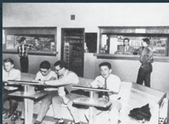
Le restaurant et le restaurant de la salle de quilles.