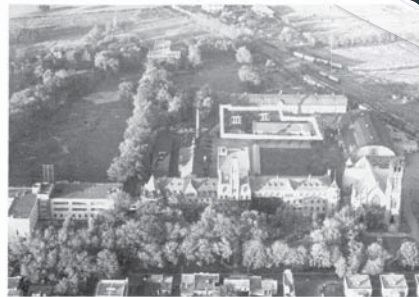
Il en fallait "grand" pour construire le nouveau gymnase !