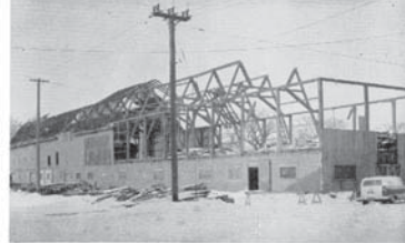
Au temps où le collège joignait les avantages de la "ville" à ceux de la "campagne", la grange avait une certaine utilité ! Mais depuis que le "village de Saint-Laurent" est devenu la dynamique cité que l'on connaît, les bêtes à cornes ont pris le chemin de Vaudreuil, après un bref séjour à Côte-Vertu.