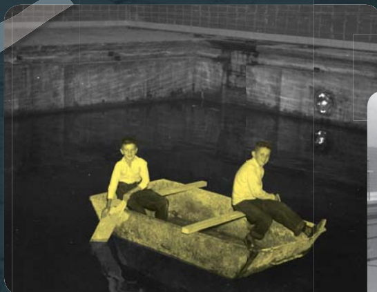
La piscine inachevée