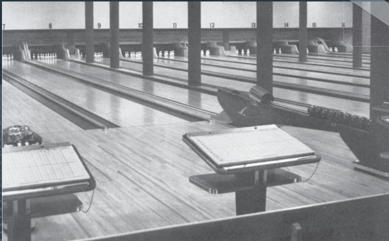
Durant la semaine d'ouverture, en janvier dernier, les élèves ont roulé 3,752 parties bien comptées. Il ne faut pas dire "L'Heure des Quilles" mais plutôt "Les Heures de Quilles"...