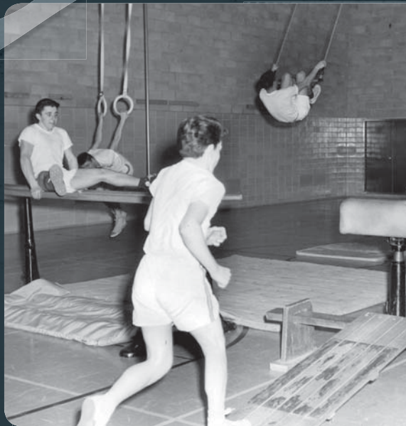
Athlétisme dans la palestre du gymnase