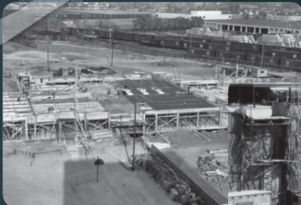
En 1956, le chantier du gymnase bat son plein!