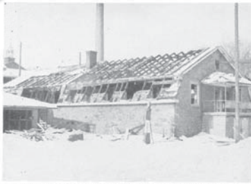
Dès février 1956, les reliques, les unes après les autres, disparaissent au bout de la cour des Grands. Le caveau n'offre aucune résistance aux engins destructeurs de Miron.