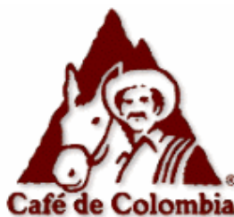
Logo de Juan Valdez©

« Juan Valdez » est le symbole et la personnification des cultivateurs cafetiers, il est un personnage fictif créé en 1959 par la « Fédération Nationale des Cafetiers de la Colombie ». Il est toujours accompagné d'une mule appelée « Conchita » qui est chargée de sacs pleins de grains de café.